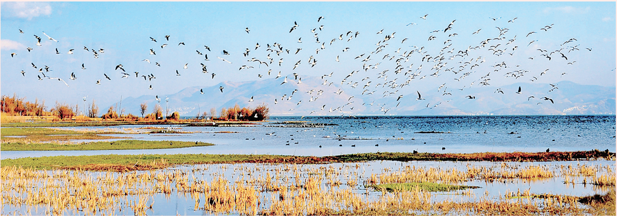
《洱海湿地生态》