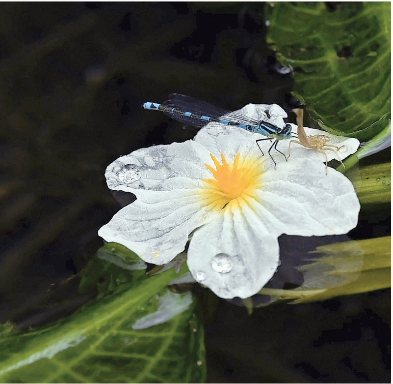
《母爱的守候》