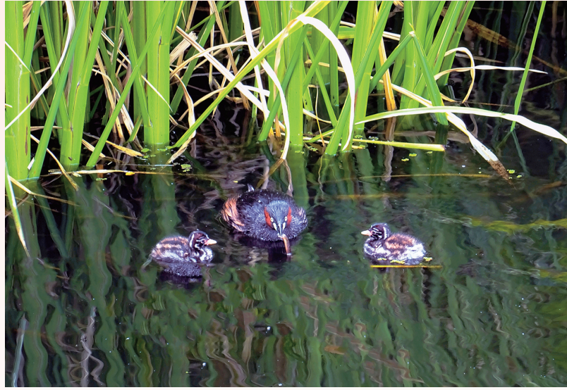
《湿地一家子》李青园 摄