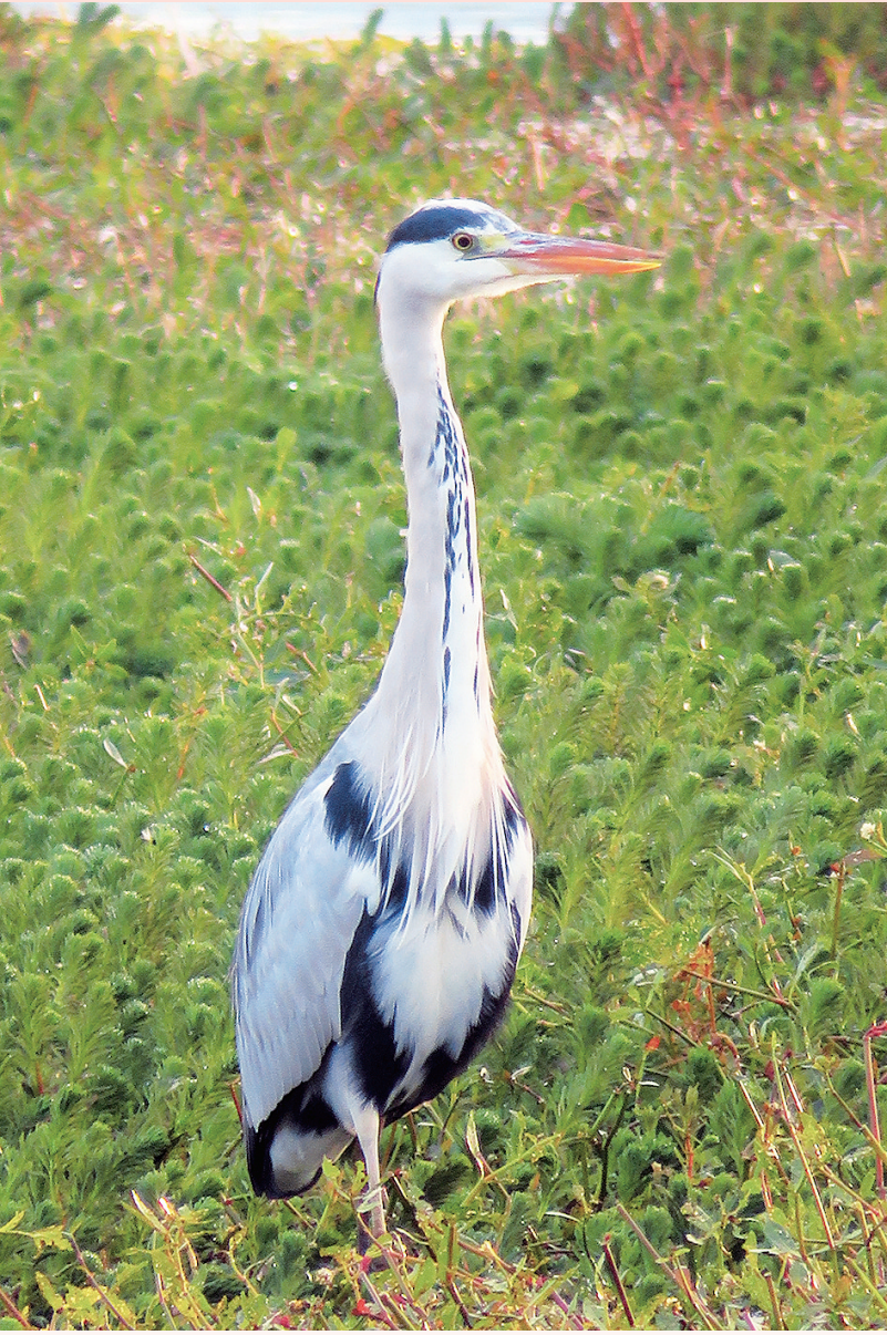
《洱海湿地上的候鸟》董芸 摄