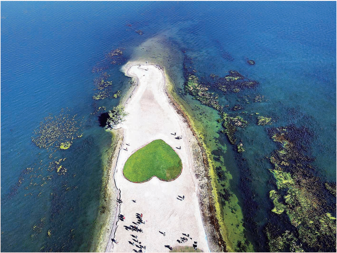
《海东湿地公园》