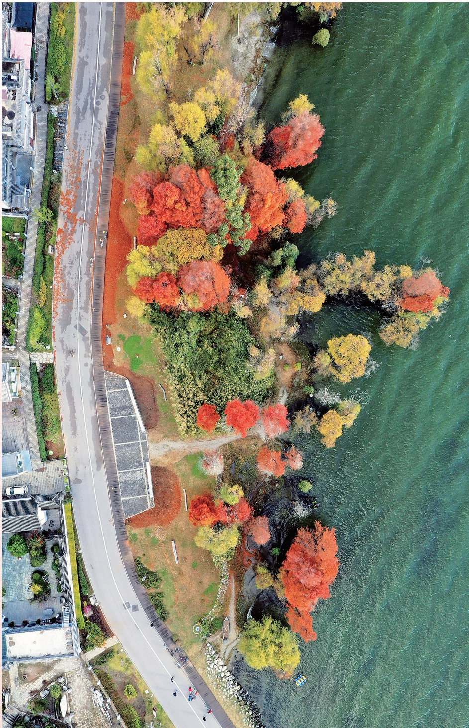
《洱海湿地秋色》